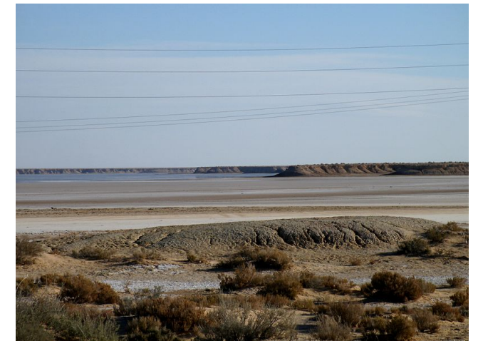
Chott Melrhir