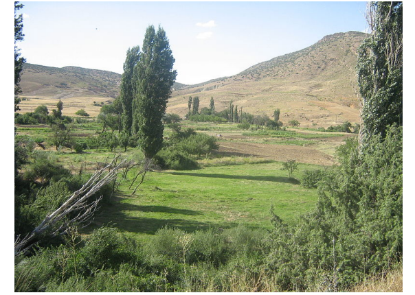
Chaîne des Aurès, à l'Est de l'Algérie