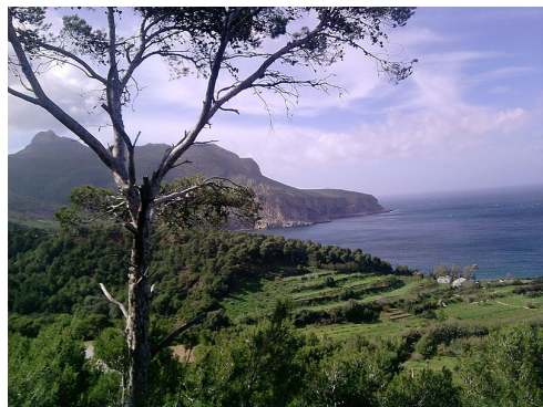
Paysage côtier

Au nord, le long du littoral méditerranéen, s'étend sur une longueur de 1 600 km la bande du Tell, large de 80 à 190 km. Cet espace est formé de petites chaînes de montagnes. La côte, très accidentée, est surtout constituée de falaises rocheuses, que viennent interrompre des baies (par exemple, celle d'Alger). Les montagnes sont séparées par de riches vallées et par des cuvettes (par exemple : la Mitidja). Cet espace est caractérisé par le climat méditerranéen, et se trouve être le plus fertile d'Algérie.