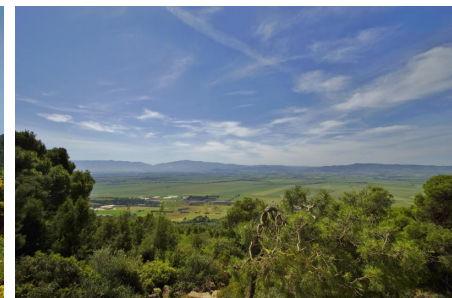
La plaine de la Mitidja