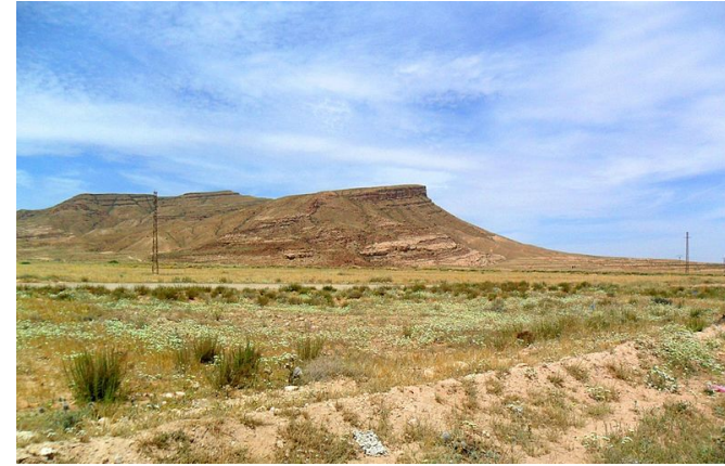
Environs de Bou Saâda, dans les hauts plateaux

Plus au Sud s'étend, d'Ouest en Est, une ceinture de montagnes divisées en deux chaînes : au Nord l'Atlas Tellien, et au Sud l'Atlas saharien. Entre ces deux chaînes s'intercalent les hauts-plateaux ainsi que des plaines semi-arides. Cet espace est caractérisé par la présence de chotts, qui sont des étendues d'eau salée alimentées de façon discontinue lors des rares pluies, et aux rivages fluctuants. Le paysage de steppe est fréquemment rencontré dans cette région.