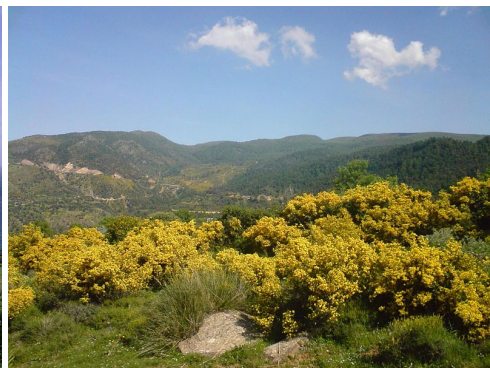
Les montagnes de Kabylie au printemps