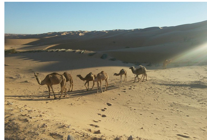
Paysage du Sahara

Au Sud de cet ensemble s'étend le Sahara. Le désert n'est pas uniforme : les principaux paysages sont les regs (étendues pierreuses) et les ergs (dunes). Le sud de l'Algérie est marqué par la présence du massif du Hoggar et du plateau du Tassili. La végétation est quasi-absente. L'aridité est ponctuée par quelques oasis ainsi que -au Nord du Sahara- par des chotts (le plus important d'Algérie est le Chott Melrhir).